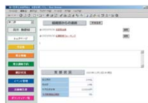
支部支援 (サンプル画面)