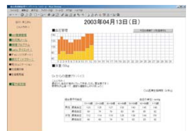
健康Webシステム (サンプル画面)